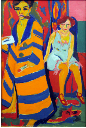
Ερνστ Λούντβιχ Κίρχνερ «Αυτοπροσωπογραφία με το μοντέλο»

(Ερωτηση: Ποια χρονική περίοδο και σε ποια χώρα αναπτύχθηκε κυρίως ο εξπρεσιονισμός; Σε ποιες δύο καλλιτεχνικές ομάδες εντοπίζεται η απαρχή του; Αναφέρεται 2 καλλιτέχνες από τις ομάδες αυτές.)