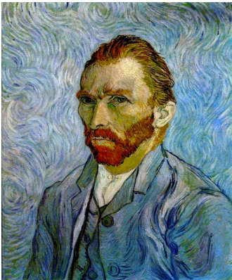
Βίντσεντ Βαν Γκογκ Ολλανδία «Αυτοπροσωπογραφία»

(Ερωτηση: Από που πηγάζει ο όρος εξπρεσιονισμός και τι σημαίνει; Γενικά πότε χαρακτηρίζουμε ένα έργο τέχνης ως εξπρεσιονιστικό και γιατί;)