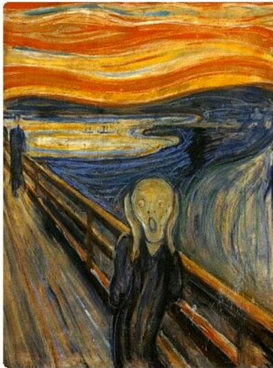
Έντβαρτ Μουνκ «Η Κραυγή»