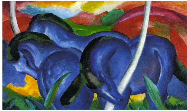
Φραντς Μαρκ «Μεγάλα Μπλε Άλογα»