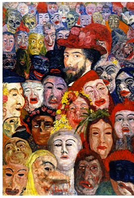
Τζέιμς Ένσορ Βέλγιο «Αυτοροσωπογραφία με μάσκες»