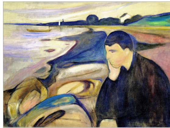
Έντβαρτ Μουνκ «Μελαγχολία»