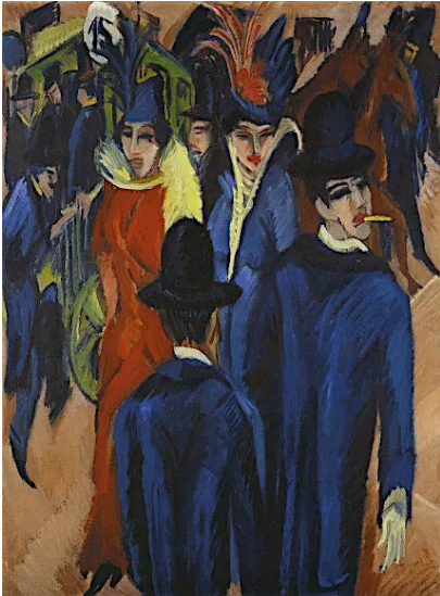
Έρνστ Λούτβιχ Κίρχνερ «Σκηνή σε δρόμο του Βερολίνου»

(Έρωτηση: Αναφέρετε 4 μορφοπλαστικά στοιχεία της εξπρεσιονιστικής ζωγραφικής. Ποιοί οι βασικοί λόγοι και σκοποί της χρήσης τους;)