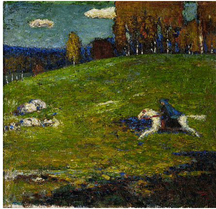
Βασίλι Καντίνσκι «Ο Γαλάζιος Καβαλάρης»